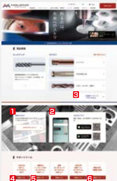
ウェブサイト トップページ Websight top page